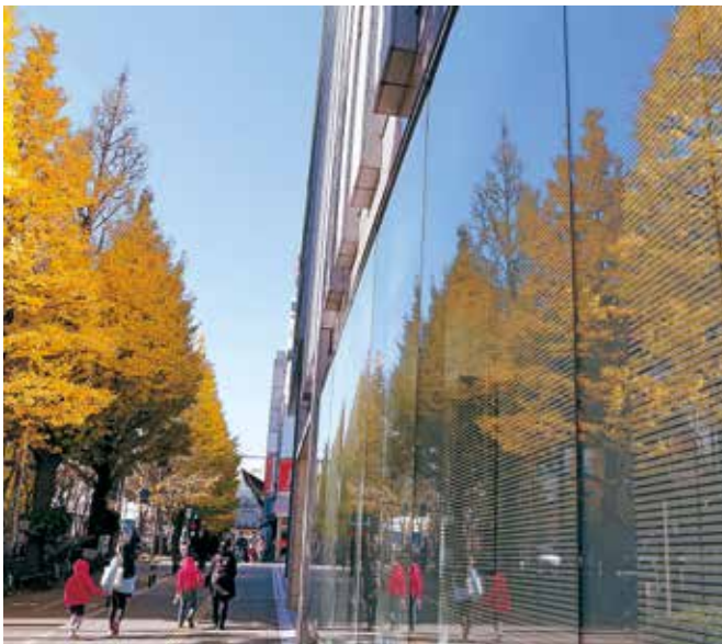
▶ 川崎市役所大通り