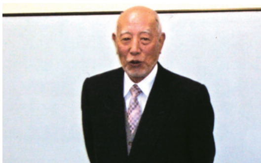
今泉講師より訓練総評