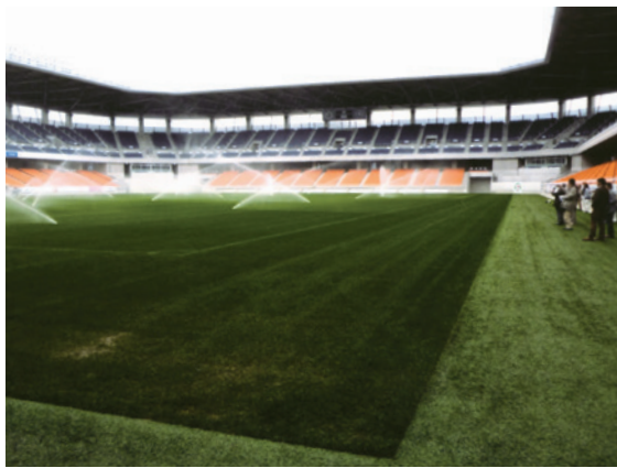
南長野運動公園総合球技場

「土に還る」素材に拘っているとの事でした。意見交換後、霧雨が降る中ガイドさんの説明を聞きながら散策をいたしました。森の中は大きな池や小さなせせらぎもあり、障害のある方でも自然に触れる事が出来るように整備されており、間伐材を炭にする炭焼き小屋もあり、落ちている空間となっていました。