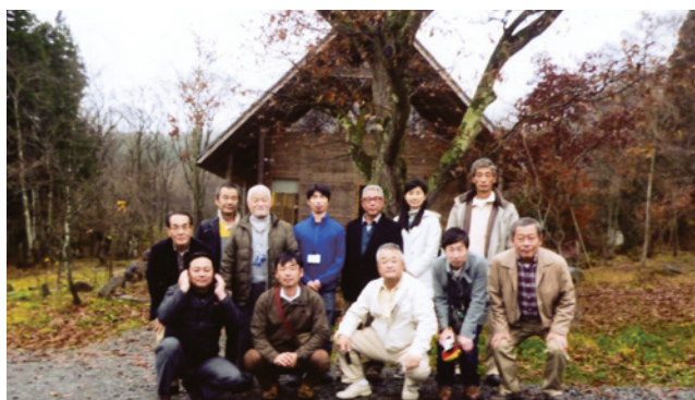
アフアンセンター前にて

今回の研修は校庭・園庭芝生化に成功した長野県に行き、地元の方々も直接お話しができ、とても参考になりました。長野県とは周辺環境も違いますが、今後どのような芝生化