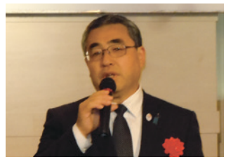
吉川伸治 神奈川県副知事 挨拶

現在、平成二十八年度当初予算の編成作業中であり、一般財源六百五十億円の財源不足が見込まれており、聖域なき