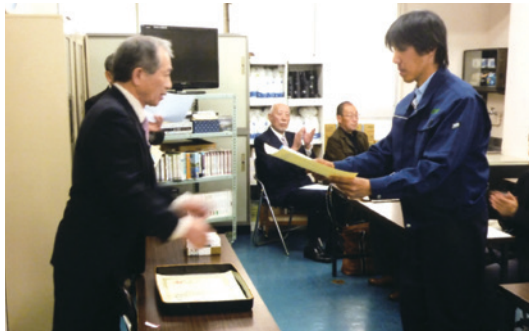
神奈川県職業能力開発協会 会長賞授与