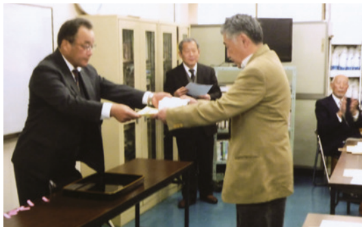
(一社)神奈川県造園業協会 会長賞授与