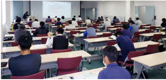
大径木講習会の様子

を企画し5月開催予定で計画を立てていましたが、新型コロナウイルスの拡大により講習会を断念することとなりました。新型コロナウイルス感染症拡大による緊急事態宣言解除を一つの目安として、法令改定直前の7月に改めて伐木補講習の計画を立てて実施しました。緊急事態宣言解除明けた