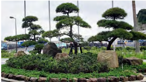
江の島メイン会場前庭の黒松3本と景石