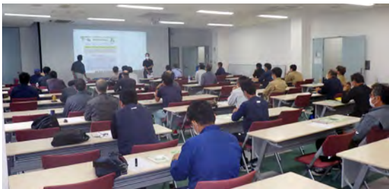
小径木講習会の様子

引き続き令和2年7月30日(木)には小径木修了者(安衛則36条8号)対象に5.0hの補講習を午前に開催し、34名と多くの受講者に参加して頂きました。