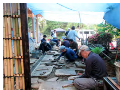
延段施工の作業風景