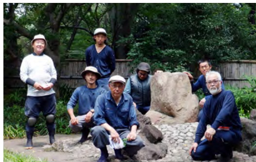
県立相模原公園内「衆遊の庭」維持管理工事参加者