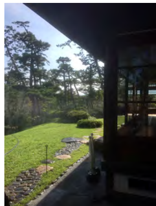
「明治記念大磯邸園」の整備