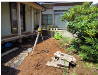
中庭の造園工事予定地

また、庭守で2013年から関わっている県立相模原公園内日本庭園「衆遊の庭」の維持管理工事参加者