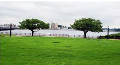
江の島北緑地芝生広場の整備