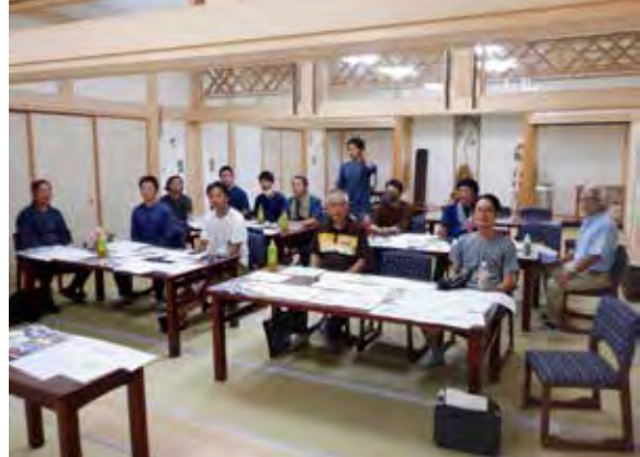
令和2年9月6日 コンペ参加者

平成30年度から庭守の活動場所として開放していただいている密蔵院(横浜市泉区和泉町)も、新型コロナウイルス感染症拡大の影響を受けてなかなか思うように作業が進められない現状ではありますが、春のお彼岸までに中庭をある程度の形にして欲しいというお施主様の意向もあり2月から着工に踏み切りました。 第一期:客殿雨落ち部分縁石と石積工事(2019年2~3月)、第二期:光悦寺垣(2019年9月)、第三期:延段を(2020年6,9月)に続く第四期工事となります。 昨年の9月6日に行ったコンペで各自が持ち寄ったプランを講師陣が一本化し、計画図面にして準備しました。 コロナ禍を配慮して事前の打ち合わせ(1月23日)は川田造園事務所で上層部のみの小人数で行い、今後の現地作業も参加の強要はせずメンバーの自己判断に委ねる形となりました。いわゆる講習会という形式での開催は難しくなりましたが、長年共に作業してきたメンバーは十分な技量を持ち合わせており、これまでの活動で培った技術を実践する段階ですので具現化する場として申し分ないと思