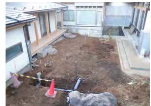
令和3年2月21日 作業後