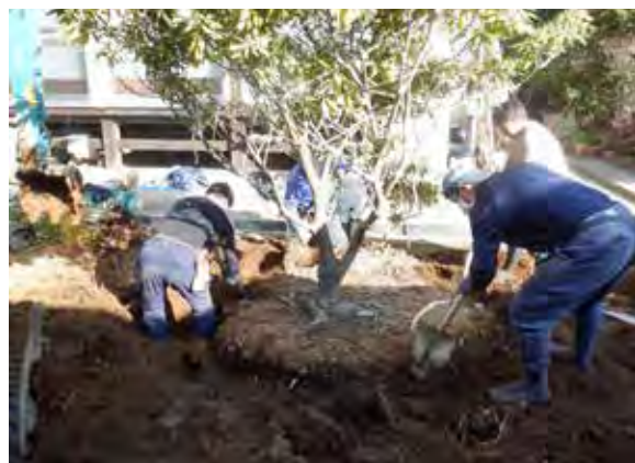
令和3年2月21日 シャクナゲ移植