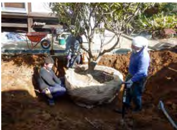
令和3年2月21日 シャクナゲ移植