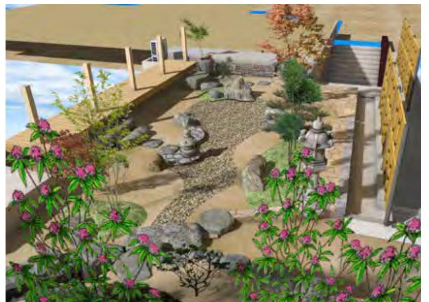
令和3年2月21日 イメージパース