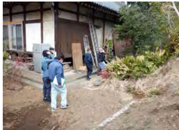
令和3年2月14日 現地打合せ