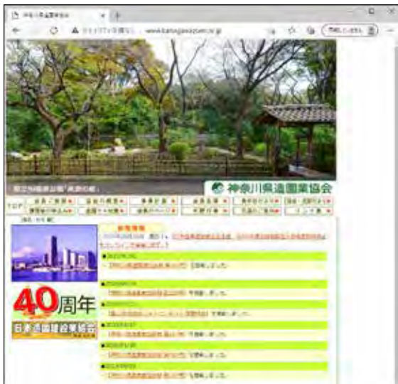
神奈川県造園業協会ホームページのトップページ