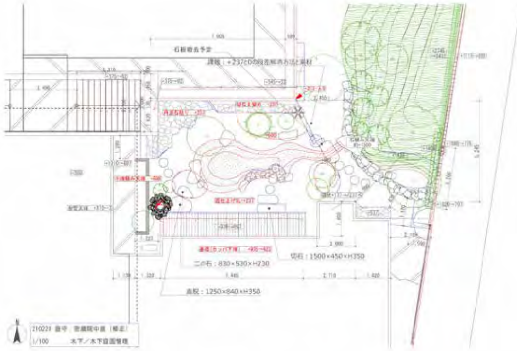
令和3年2月21日 中庭計画平面図