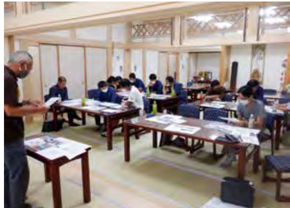
令和2年9月6日 プレゼン風景