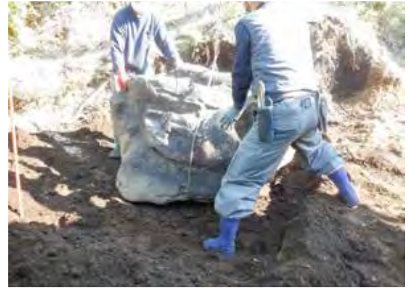
令和3年2月21日 水堀石据付