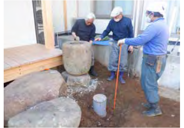
令和3年2月21日 手水鉢据付