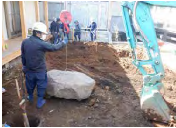
令和3年2月21日 沓脱石搬入