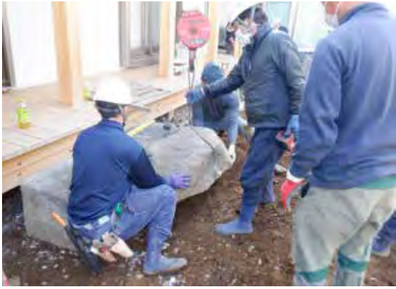
令和3年2月21日 沓脱石据付