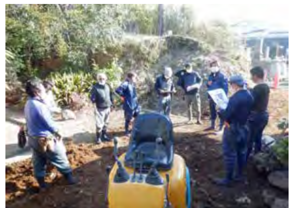
令和3年2月21日 ミーティング