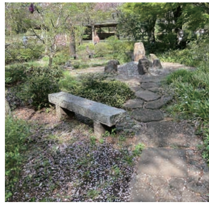
相模原公園施工前