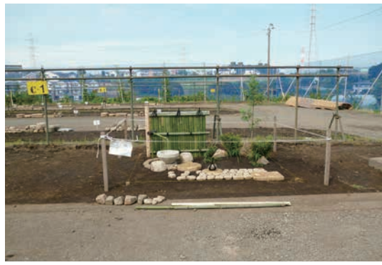
技能検定 1 級課題モデル