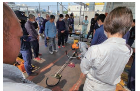
刈払機安全講習会