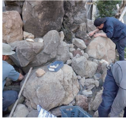
舞岡 滝石組み施工中