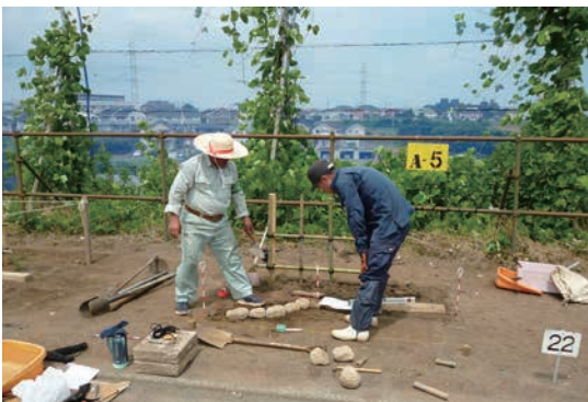
技能検定 3 級実技講習会