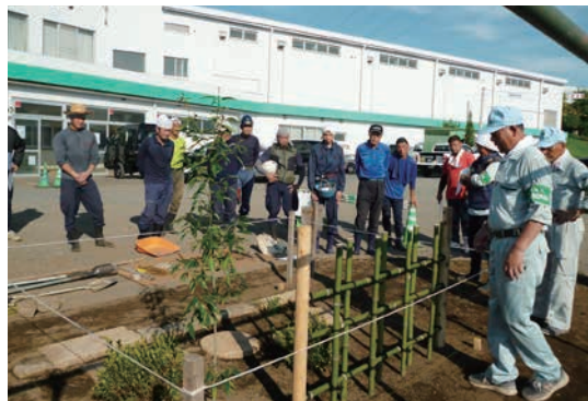
技能検定 2 級実技講習会 (オリエンテーション)