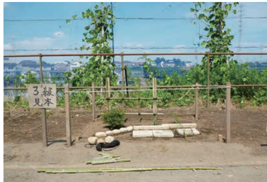
技能検定 3 級課題モデル