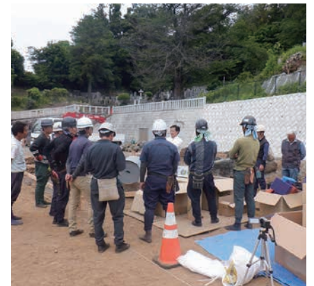
グローベン式ポンドシートの研修