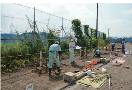
技能検定 3 級実技試験