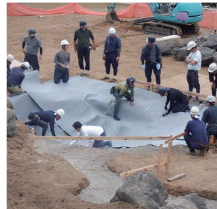
ポンドシートの敷設