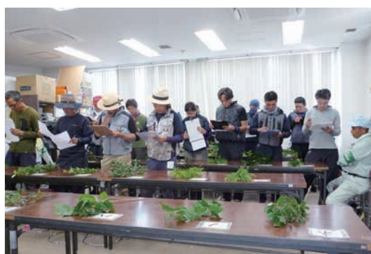
技能検定樹種判定模擬試験