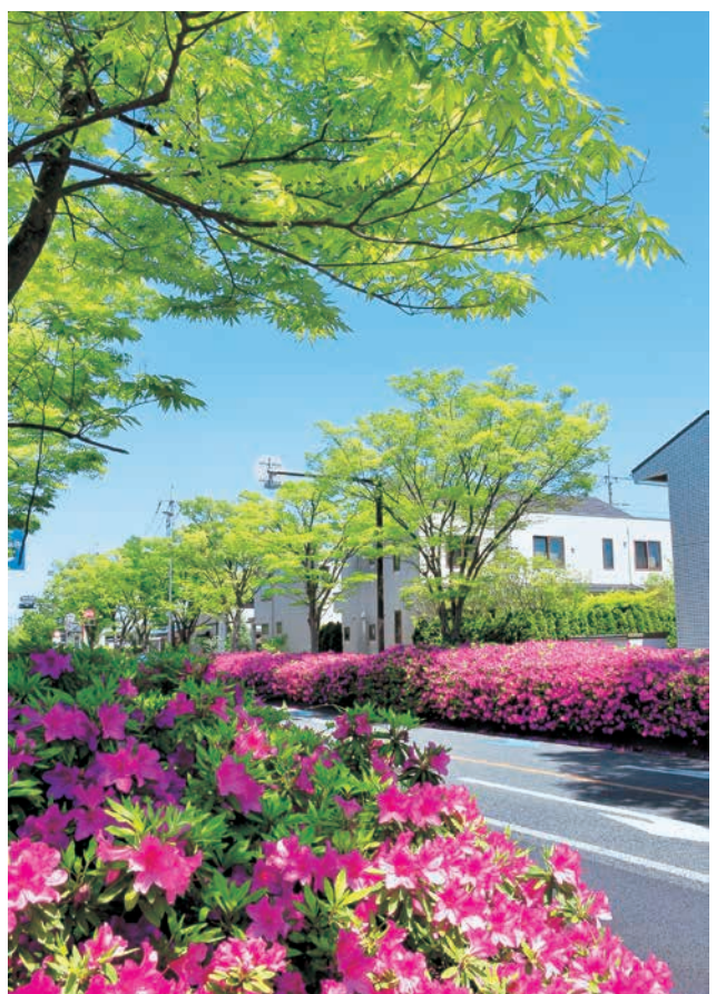
最優秀賞「つつじと街路樹」

(社)日本造園建設業協会神奈川県支部主催の「第十七回かながわ街路樹フォトコンテスト」表彰式が五月三十日、ロイヤルホールコハマで開催されました。