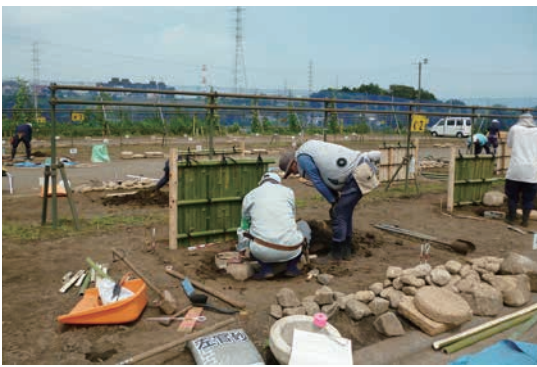
技能検定 1 級実技講習会