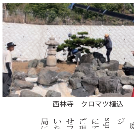
西林寺 クロマツ植込

6月より始まった西林寺での活動は元々は計画に無かった工事で諸事情により急遽対応することになりましたが、営利が絡む事業ですので任意団体である庭守としては対応が難しい面があります。