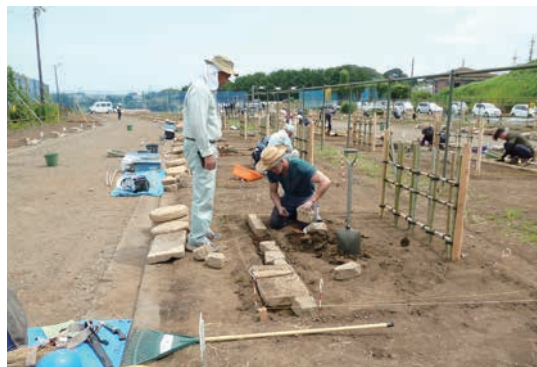
技能検定 2 級実技講習会