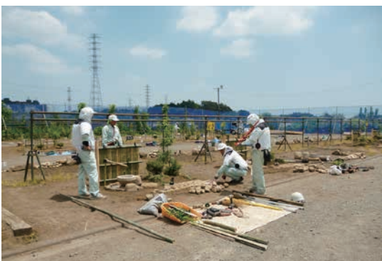
技能検定 1 級実技試験