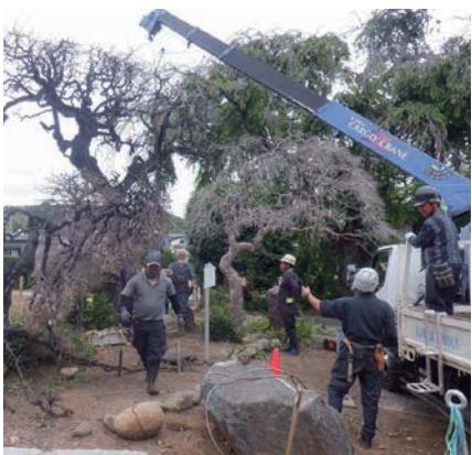
焼失した木々の撤去