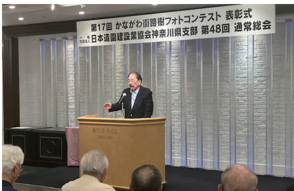
大河原審査委員より講評