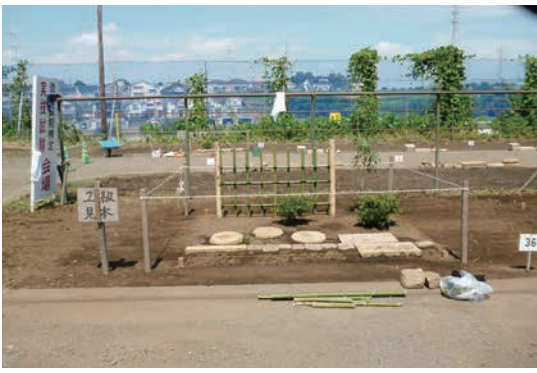
技能検定 2 級課題モデル