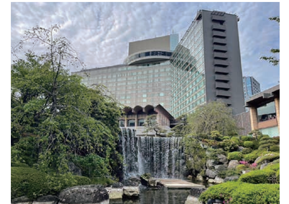
ホテルニューオータニ

午後のお寺として有名な柴又帝釈天『題経寺遼漢園』彫刻のお寺としても有名な山本亭です。この庭園は2019年に米国の日本庭園専門誌で4位にランクインし、2003年以降は常に上位7位以内に入っているとのこと。山本亭は池泉・築山・滝などを設けた典型的な書院庭園であり、国内外で高い評価を受けています。庭園内には立ち入ることができないため、渡り廊下を歩きながら見学し、池には石橋、庭石、雪見灯籠、さまざまな植栽