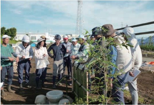
技能検定 1 級実技講習会 (オリエンテーション)