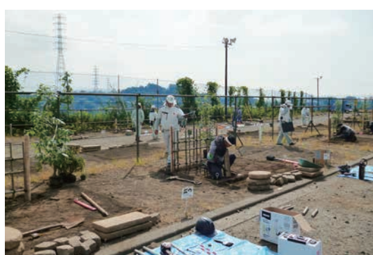
技能検定 2 級実技試験